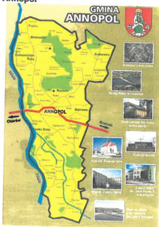
Mapa 1. Mapa Gminy Annopol

Od zachodu naturalną granicę gminy wytycza rzeka Wisła.